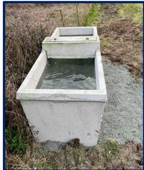
Prosiect Aforn Wygyr ymhle bu cydweithio rhwng ffermwyr lleol a'r Cyngor i leihau nitradau a rhyddheir i ddŵr afonydd