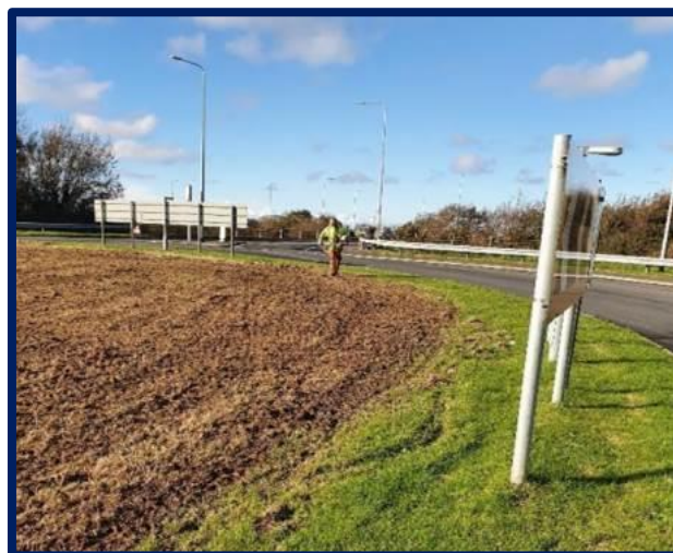
Gwaith paratoi ar gyfer blodau gwyllt ar 13 o gylchfannau Ynys Môn